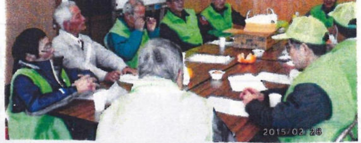
2/28 真剣に討議するメンバー