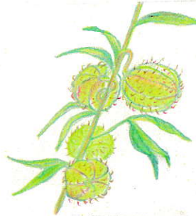
風船唐綿 フウセンノウワタ

草を抜きカンナを整え衰えたマリゴールドを抜いた。道路際のマリゴはまだ色が良いから残しておこう。