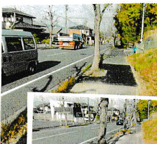
自転車族のじいじの願いが叶った。(12/9)