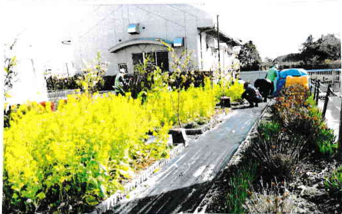
KEBAN 隣りの花畑が待っていた。菜の花が...。こは日当たりがよいので早い。

葎は伸びていないがカンナノ葉など枯れて汚ない。風船磨綿がいまや主人公のようだ。切り花にして花瓶の中で永く青い実を見せられる。