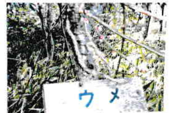
5号公園回廊の梅 日当たり悪いのにむ蓄を抱いた。いつ植えたの？ "フルチ&ガッパーナ 香水のせいだよ" J