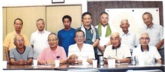
グリーンパトロールの精鋭です (8/4)

* ボランテア清掃の事前作りは何年も続けてきまし た。これからは自治会にお任せします。