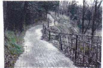
回廊は枯草がはやくきれいだ。