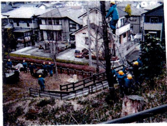
高木にのぼって引き網を引っ張るシルバー

3/2 市に依頼していた5号公園の枯れ木の伐採 2号公園の土手の草刈りが行われた。シルバーセンターの手にかかると