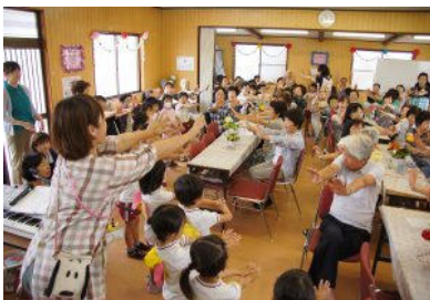
“高齢者どうしの憩いの場所”