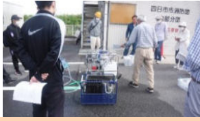
浄水装置(電動)の起動