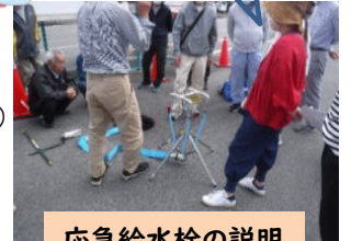
応急給水栓の説明