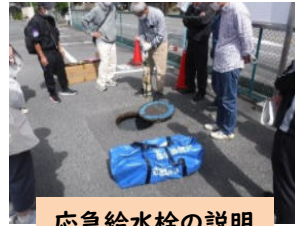
応急給水栓の説明