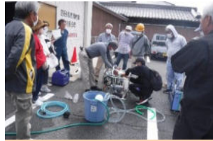
浄水器(手動式)の操作