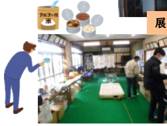
展示会会場の風景