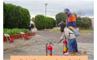
消火器の取り扱い訓練