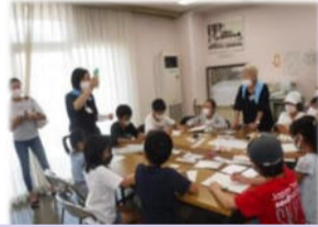
防災リュックの中身クイズ