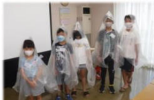
カッパが出来ました