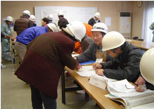
各会場より情報収集(本部)