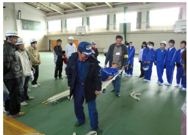
(訓練) 担架訓練(中学生の参加)