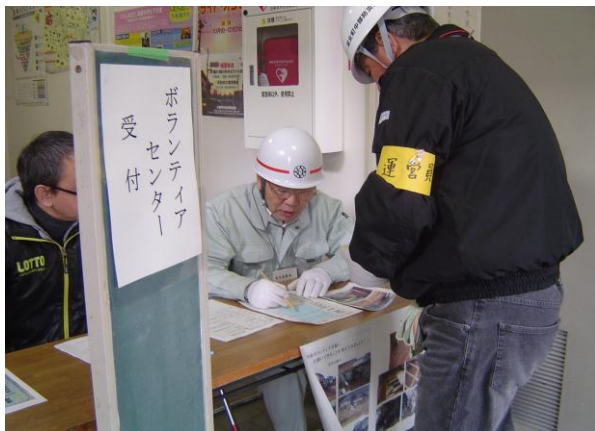
一般ボランティア受付と指示(本部)