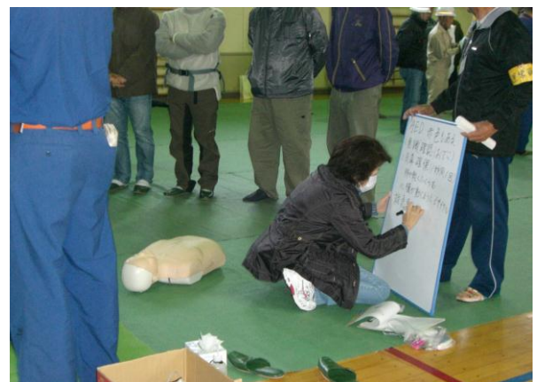
会場での情報収集(東小)