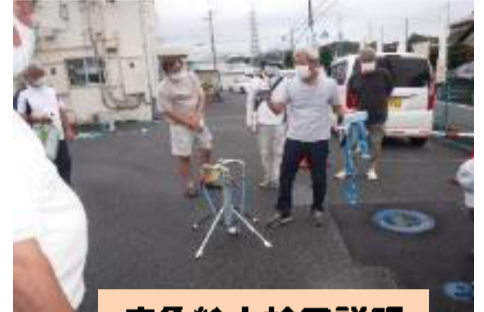
応急給水栓の説明