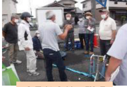
応急給水栓の説明