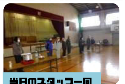
当日のスタッフ一同