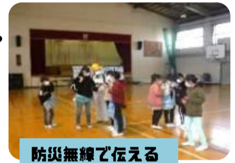
防災無線で伝える