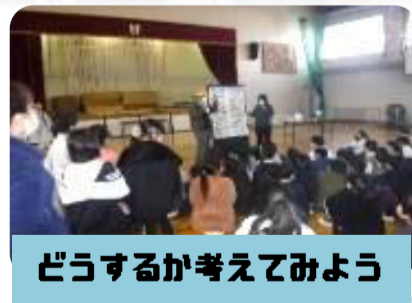
どうするか考えてみよう