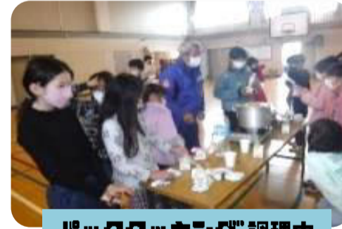
パッククッキング調理中