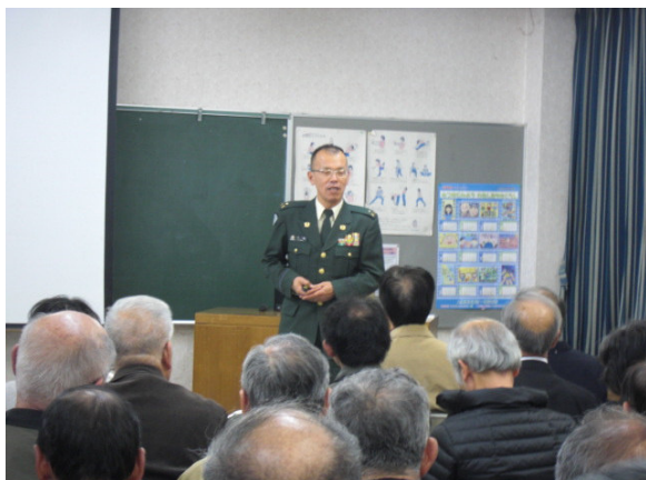
(小田講師) は極一部で、ほとんどは混乱している。高齢者のわがままがひどい。お金や盗製品等の窃位の来訪者が多数ある。

救助・捜索活動での体験、災害は悲惨である。遺体について、女性の背に一歳くらいの幼児、右手にしっかりと三歳くらいの子供、その遺体に対面した。隊員達は呆然とし泣きながら収容した。顔・頭は水で丁寧に洗う。被災地の状況、被災者は自分のことしか考えられない。目の前のことで精一杯になる。整列云々